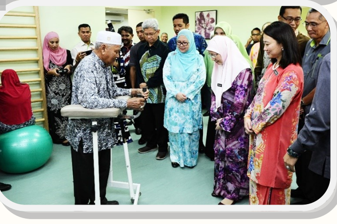
Aktiviti YAB Timbalan Perdana Menteri sepanjang Program Salam Ramadan

Pada 24 Mei 2019 telah diadakan Program Salam Ramadan Bersama YAB Dato' Seri Dr Wan Azizah binti Wan Ismail, Timbalan Perdana Menteri Malaysia bertempat di Kompleks Warga Emas, Darul Hanan, Pongsu Seribu, Kepala Batas. Antara aktiviti yang dijalankan semasa program berlangsung ialah sesi memasak bubur lambuk, lawatan ke Pusat Aktiviti Warga Emas (PAWE) dimana terdapat homestay , bilik rawatan spa dan bilik gimnasium. Lawatan diteruskan lagi ke bilik fisioterapi yang turut dirasmikan oleh YAB Timbalan Perdana Menteri pada hari yang sama. Seterusnya, lawatan diteruskan ke bilik warga emas yang terlantar ( bed ridden ) dan YAB Timbalan Perdana Menteri turut menyampaikan sumbangan Hari Raya Aidilfitri kepada semua warga emas di kompleks tersebut.