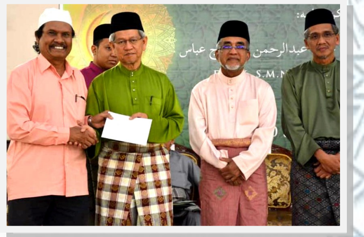
Sebahagian penerima bagi program Hari Wakaf Pulau Pinang 2019

Hari Wakaf Pulau Pinang 2019 telah berlangsung dengan jayanya pada 17 Mei 2019 bersamaan 12 Ramadan 1440H bertempat di Masjid Abdullah Fahim, Kepala Batas, Seberang Perai Utara, Pulau Pinang.