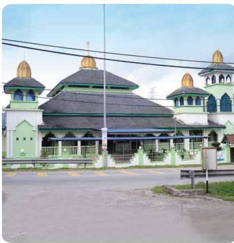
Masjid Jamek Kg. Mengkuang Sg. Lembu, Bukit Mertajam. Lot 845, Mukim 18, Seberang Perai Tengah (0.79 ekar) RM484,000.00 Tahun 2015