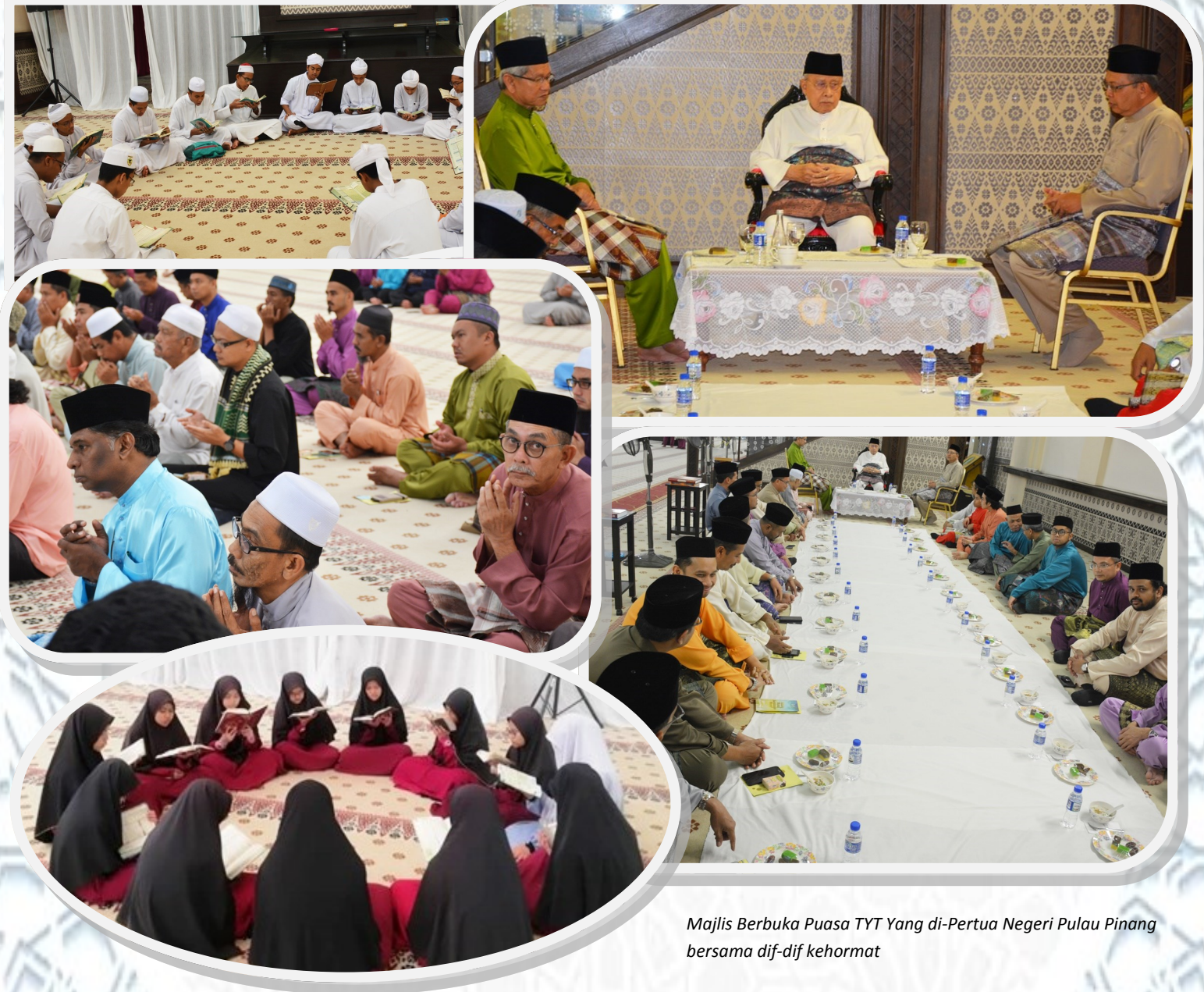
Majlis Berbuka Puasa TYT Yang di-Pertua Negeri Pulau Pinang bersama dif-dif kehormat

Satu lagi kaedah baru sumbangan diperkenalkan iaitu melalui penggunaan Aplikasi Mudah Alih Snap 'N' Pay Dana Wakaf Pulau Pinang yang boleh diakses melalui telefon mudah alih. Pada hari berkenaan juga diadakan pelancaran Tabung Wakaf Sumbangan Masjid yang bertujuan untuk mengumpul dana wakaf melalui kutipan tabung di masjid-masjid seluruh negeri Pulau Pinang pada hari Jumaat untuk membiayai projek pembelian hartanah bagi kepentingan Islam di negeri ini. Kaedah ini juga merupakan satu cara untuk mewujudkan jaringan dana kewangan umat Islam melalui institusi masjid sekaligus melibatkan masjid sebagai tunggak pembangunan ekonomi umat Islam sekaligus meninggikan syiar Islam melalui pembinaan entiti masjid madani di negeri ini.