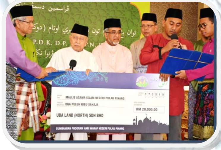
Sebahagian penyumbang bagi program Hari Wakaf Pulau Pinang 2019