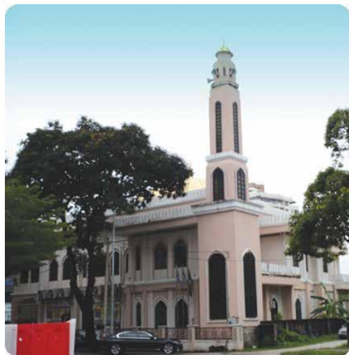
Masjid Jamek Munawwar, Jalan Kelawai, Georgetown. Lot 1286, Sek. 4, Georgetown, Daerah Timur Laut (0.17 ekar) RM895,000.00 Tahun 2005