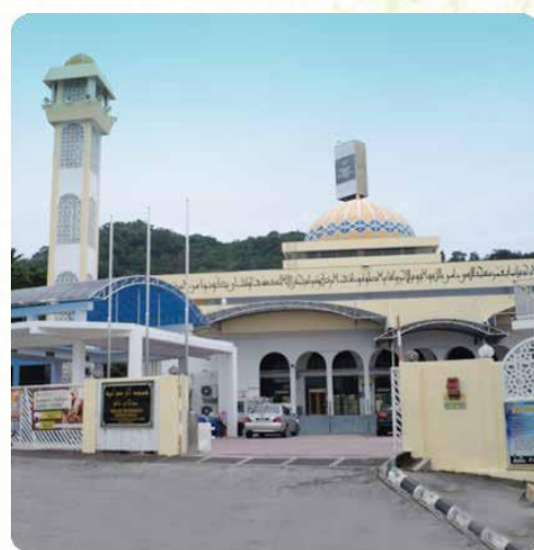
Masjid Jamek Ridwaniah, Sungai Batu, Teluk Kumbar. Lot 886 & 887, Mukim 11, Daerah Barat Daya (0.26 ekar) RM355,000.00 Tahun 1998